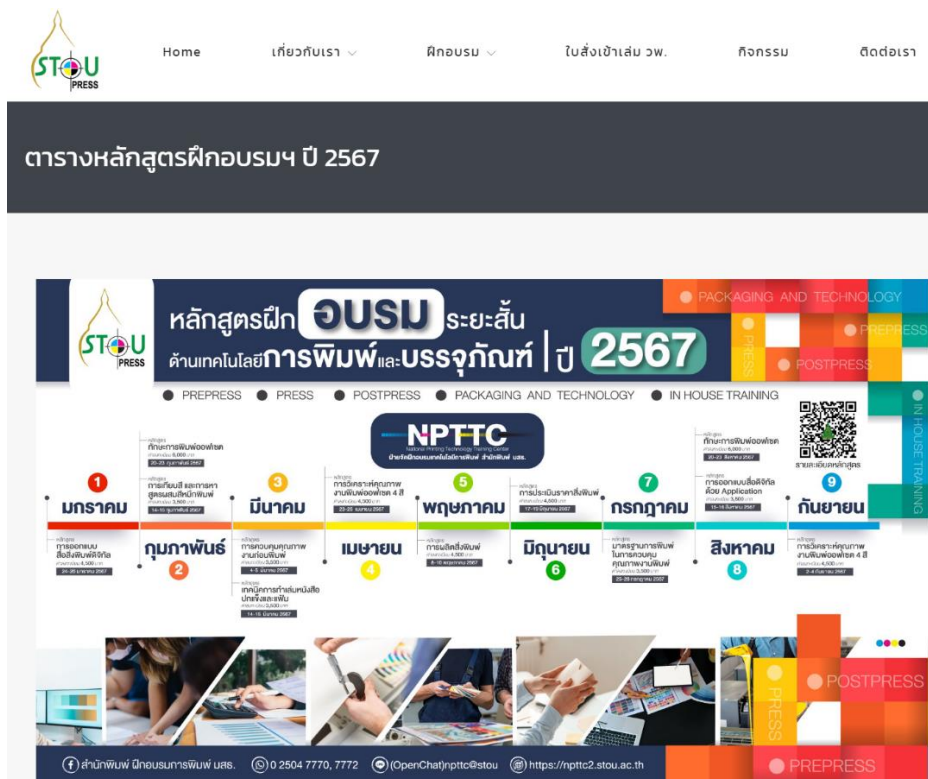
ตารางหลักสูตรฝึกอบรมระยะสั้น ด้านเทคโนโลยีการพิมพ์และบรรจุภัณฑ์ ปี 2567 (ข้อมูลอัปเดต วันที่ 21 มีนาคม 2567)

4. ศึกษารายละเอียดหลักสูตรต่างๆ กำหนดวันจัดฝึกอบรม พร้อมอัตราค่าลงทะเบียน โดยผู้สนใจสามารถสมัครฝึกอบรมในรูปแบบออนไลน์ได้ โดย เลือกคำว่า “สมัครฝึกอบรม คลิก”